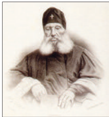
Портрет митрополита Киевского и Галицкого Филарета (Амфитеатрова). Литография П. Ф. Бореля. Первая половина XIX века

Вскоре молодого священника перевели в кафедральный собор города Лихвина Тульской губернии (с 1944 года — город Чекалин Тульской области). Затем некоторое время он