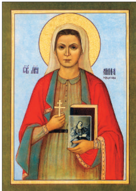
Икона новомученицы Анны Зерцаловой

Амфитеатрова», на которой для привлечения паломников «инсценировала чудеса». Далее последовал расстрел на Бутовском полигоне 17 . Юбилейный Архиерейский Собор 2000 года причислил Анну Зерцалову к лику новомучеников и исповедников Российских.