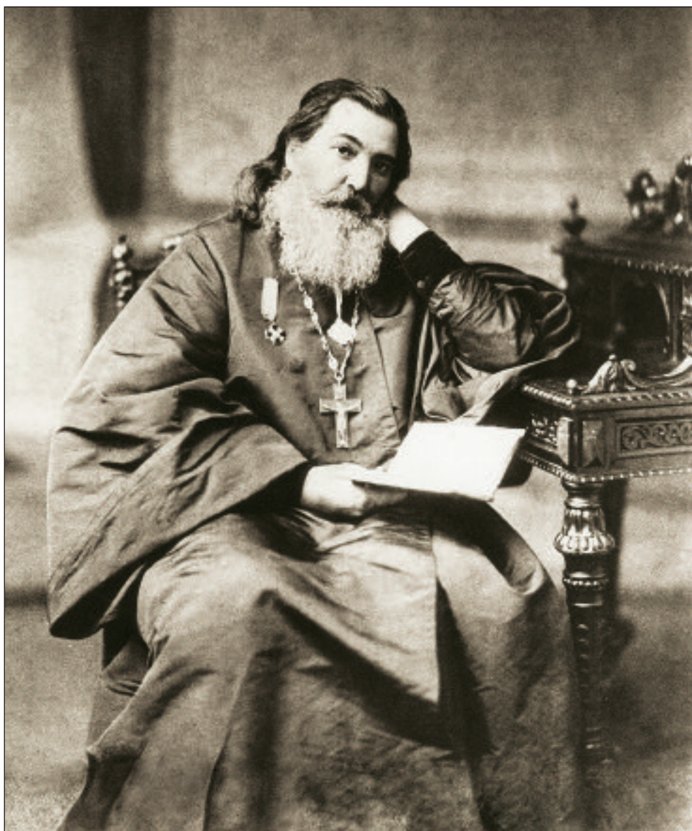
Протоиерей Валентин Амфитеатров. Фотография 1880-х годов

К 100-летию со дня кончины протоиерея Валентина Амфитеатрова (1836–1908) — известного московского проповедника, подвижника благочестия